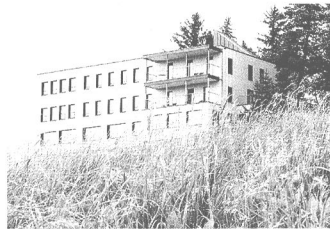
Panoramahotel Alpenhof.

Alpenhof für künstlerische Produktion und Kommunikation zu sichern. 2007 konnte die Liegenschaft von der Genossenschaft erworben werden, und nun wartet sie frisch renoviert auf Gäste. Besonders gern gesehen sind Projektschaffende, die sich für Tage, Wochen oder auch Monate in die Arbeit stürzen wollen. Ihnen werden spezielle Tarife gewährt. Sehr gelungen ist auch die Installation der Bibliothek von Andreas Züst. Man kann in der Literatur versinken und ab und zu die Blicke schweifen lassen, den tiefen Abhang in den Wald hinab. Einziger Wermutstropfen: Ein Frühstück wird nicht serviert. Für alles, was die kulinarische Versorgung betrifft, muss man sich auf die zwei benachbarten Lokale verlassen.